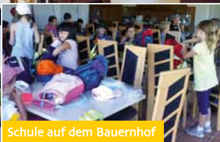
Schule auf dem Bauernhof