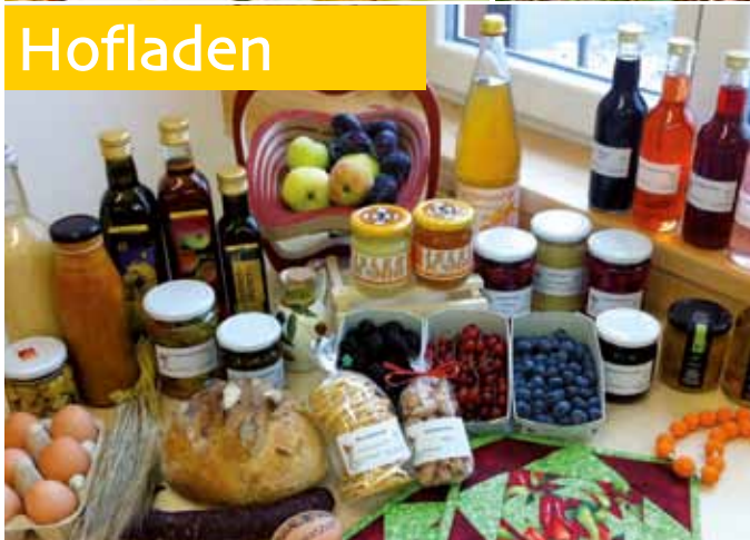
Beeren, Früchte, Eingemachtes und Selbstgemachtes